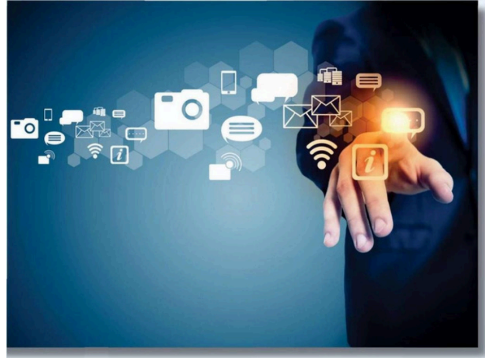
Tablo 8: Donanım ve Teknolojik Kaynaklarımız