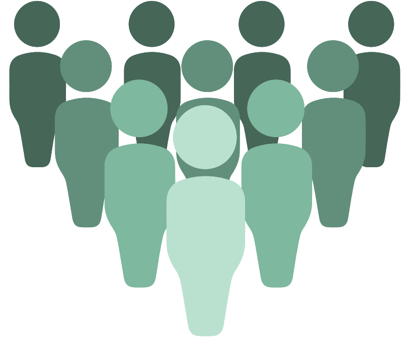
Tablo 2: Okul stratejik planlama ekibi