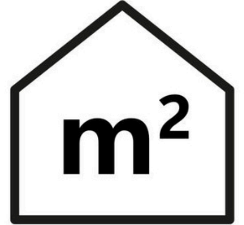
Tablo 5: Okul bina ve alanları